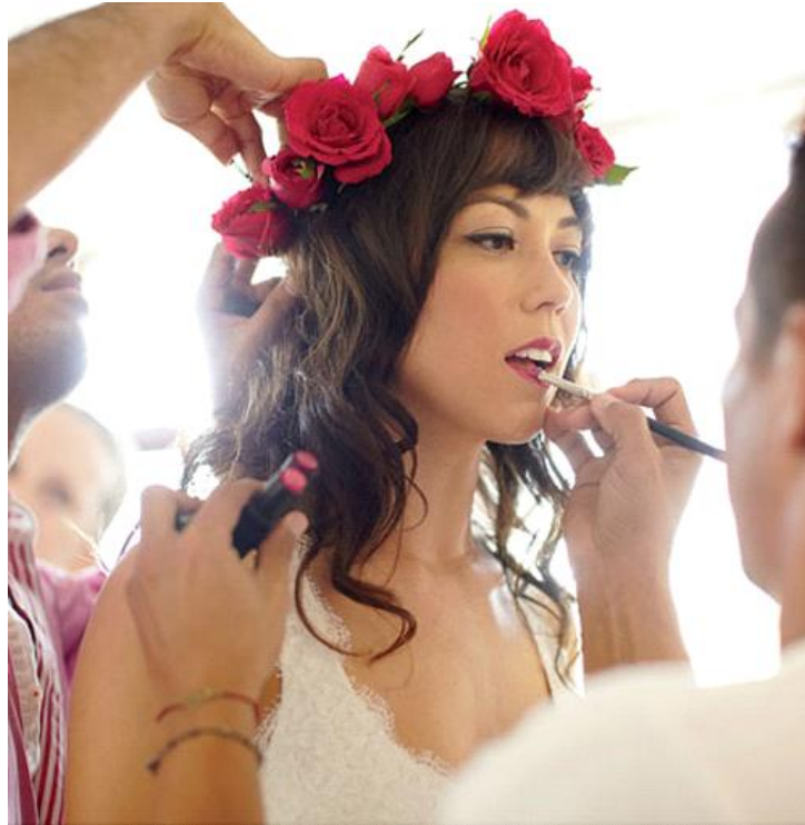
Corona de rosas rojas para novias de moda en 2013