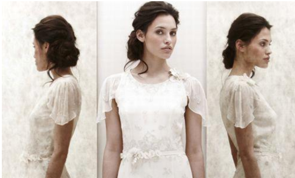
Peinado de 2013

¿Quién dice que los peinados de novia no pueden tener un toque despeinado? tienen ese toque de trenzas desordenadas el cabello recogido pero con unos pequeños cabellos fuera de lugar, como si hubieran sacado la cabeza por la ventanilla del auto.