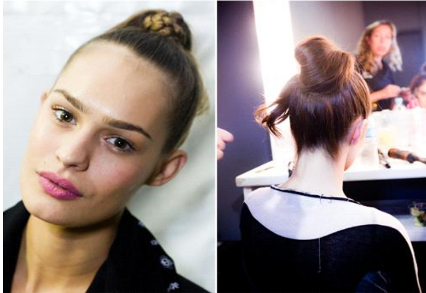
Peinado coque alto

Chongos trenzados y los peinados más vistos en los Oscars son altos, pero el estilo Coque también puede ser bajo.