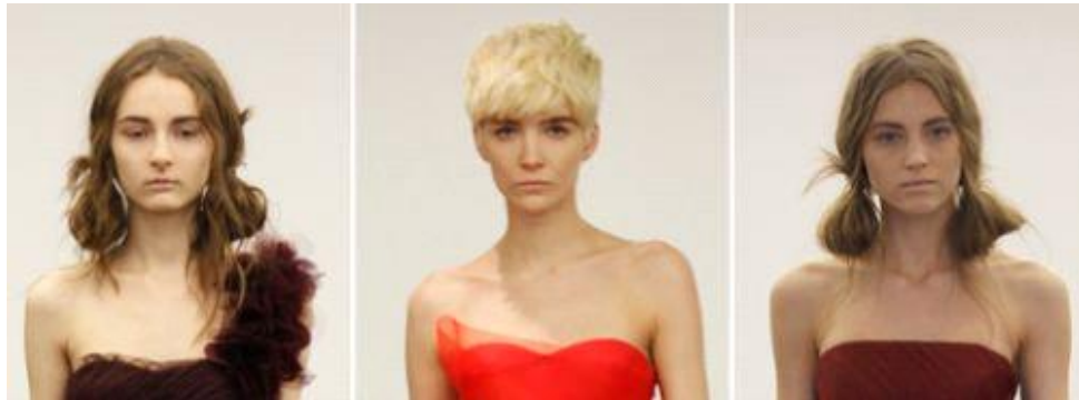
Peinado de novia 2013

¿Quién dice que los peinados de novia no pueden tener un toque despeinado? tienen ese toque de trenzas desordenadas el cabello recogido pero con unos pequeños cabellos fuera de lugar, como si hubieran sacado la cabeza por la ventanilla del auto.