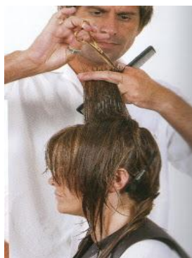
nos dio la cap dro Fabela Su

4.- tomando mechales al azar debes cortar con la punta de la tijera solo parte de las secciones.