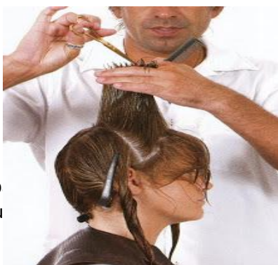
erlos realic 0, Toluca,